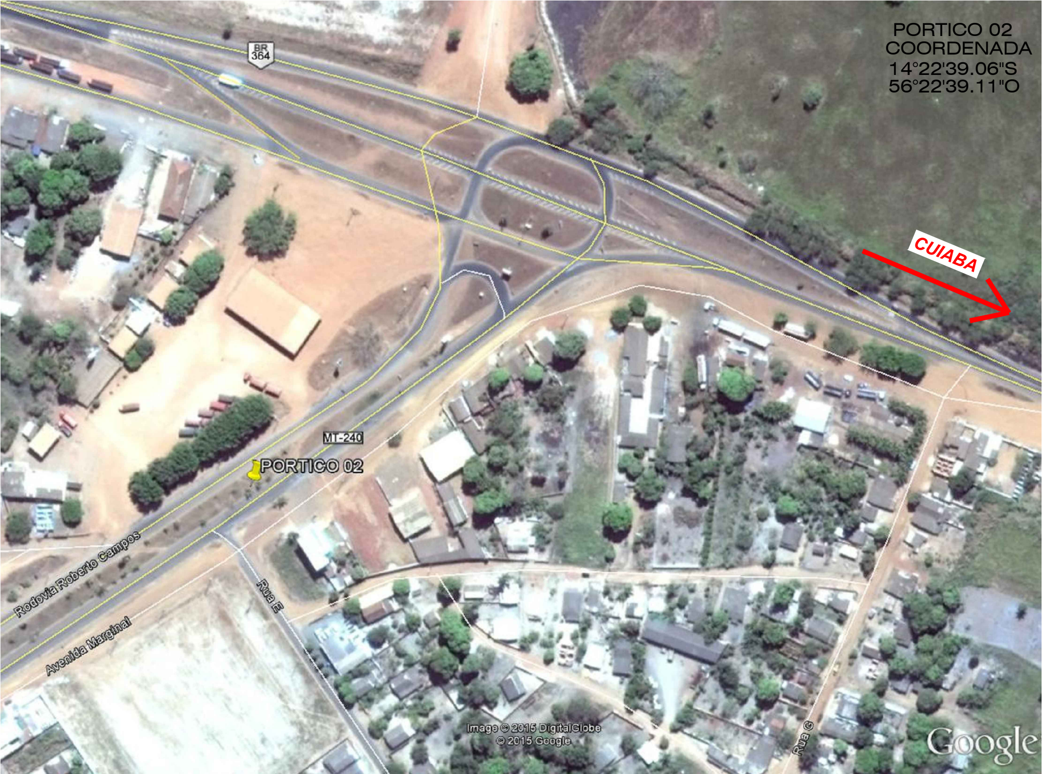
ARQUITETONICO LOCALIZAÇÃO SEM ESCALA