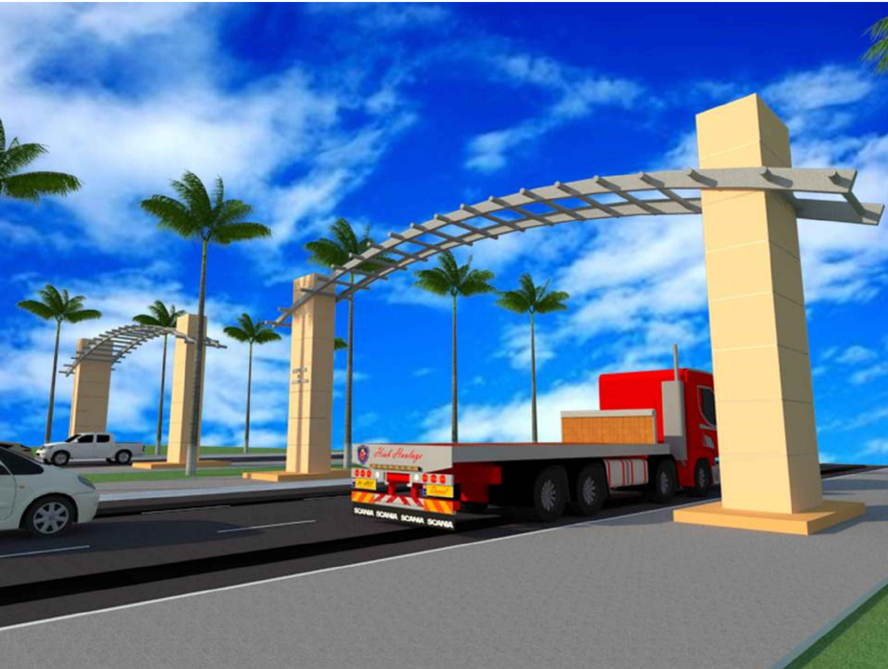
ARQUITETONICO PERSPECTIVAS SEM ESCALA